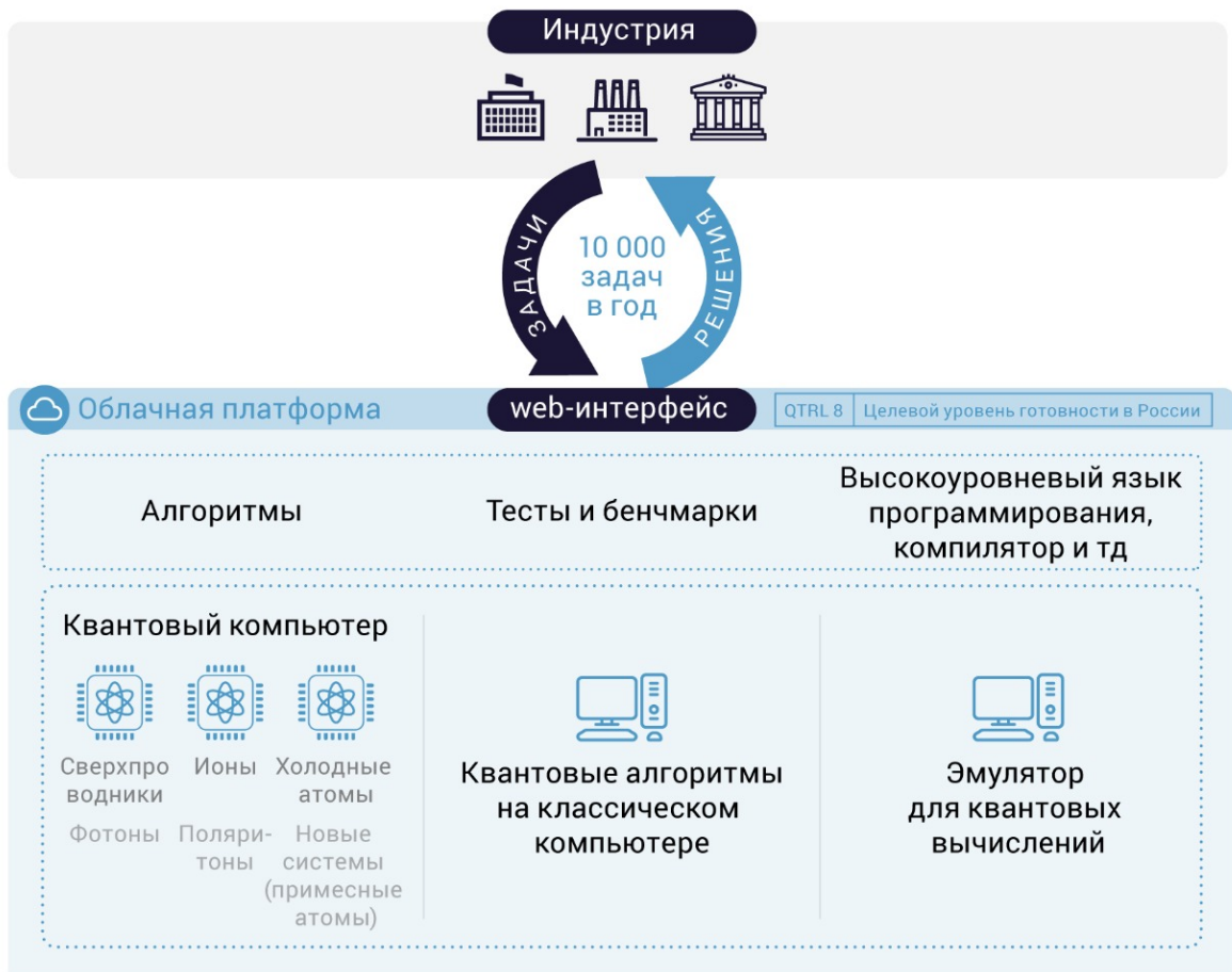
Рис. 1. Квантовые вычисления для решения задач индустрии к 2024 г.

Лидирующие организации: ВНИИА им. Н.Л. Духова; ИАЭ СО РАН; Институт прикладной физики РАН (Нижний Новгород); Институт спектроскопии РАН (ИСАН); ИТФ им. Л.Д. Ландау РАН; ИФП А.В. Ржанова СО РАН; ИФП им. П.Л. Капицы РАН; ИФТТ РАН; КНИТУ–КАИ; КФТИ; КФУ; Московский государственный педагогический университет (МПГУ); МГТУ им Н.Э. Баумана; МФТИ; НИТУ МИСиС; Новосибирский государственный технический университет (НГТУ, Новосибирск); Российский квантовый центр (РКЦ, ООО «МКЦТ»); Сколковский институт науки и технологий (Сколтех); Университет ИТМО (ИТМО); ФИАН им. П.Н. Лебедева; ФТИ им. А.Ф. Иоффе; ФТИАН им. К.А. Валиева РАН; Центр квантовых технологий МГУ им. М.В. Ломоносова (ЦКТ МГУ им. М.В. Ломоносова).